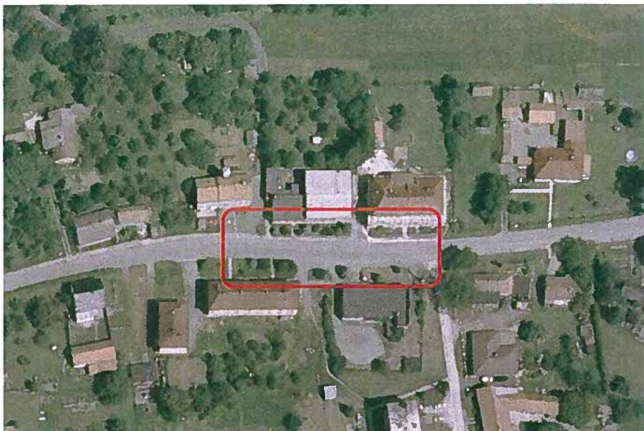
Grafická příloha č. 1.